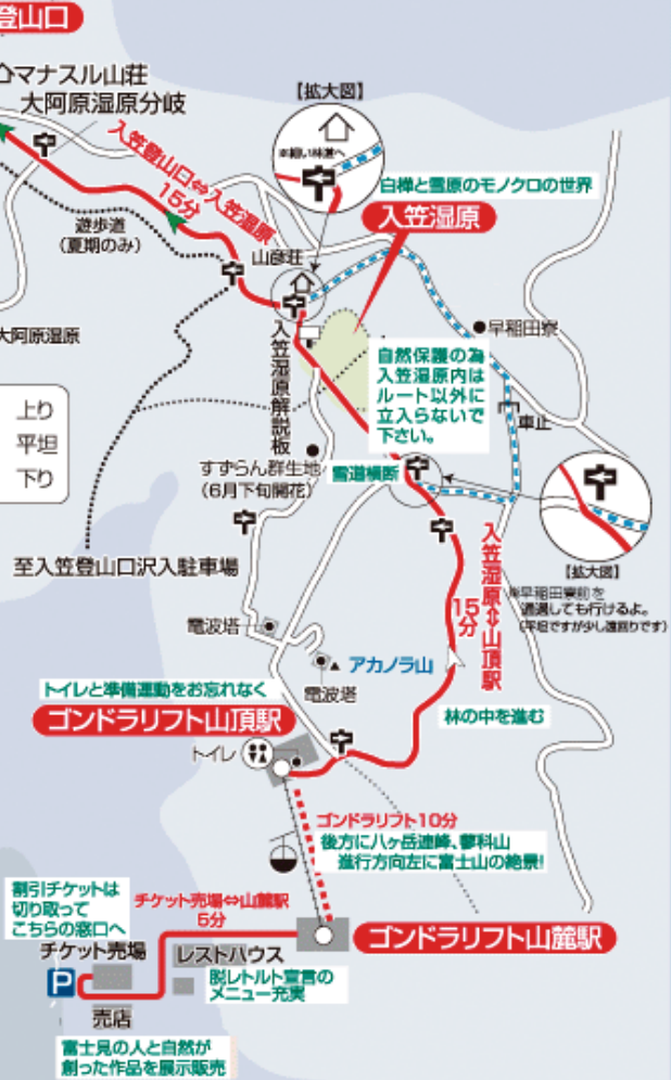
山頂からの360度大パノラマの眺望