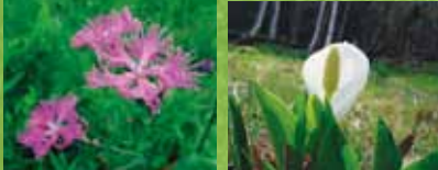
カワラナデシコ (花期: 7月上旬) ミスバショウ (花期: 5月上旬)