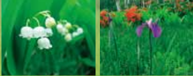
スズラン (花期: 6月上旬) ノハナショウブ (花期: 7月上旬)