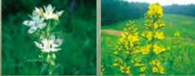
アケボノソウ (花期: 8月中旬) クサレダマ (花期: 8月上旬)