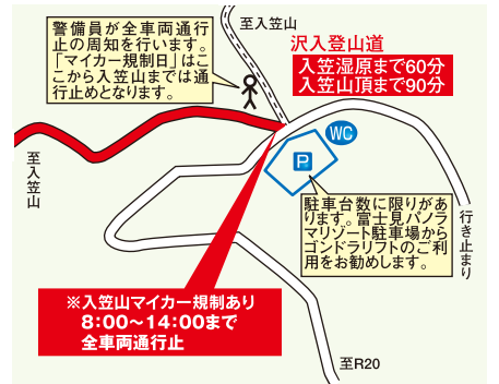
C 拡大図 入笠山周辺