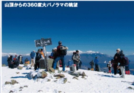
山頂からの360度大パノラマの眺望